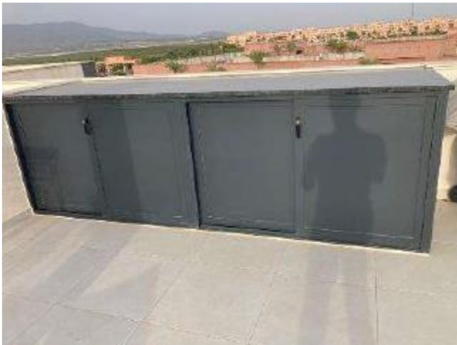
IMAGEN 9.13: ARMARIOS

Se permite la provisión de armarios contenedores en blanco y antracita siempre y cuando su altura sea igual o inferior a la pared que bordea la terraza.