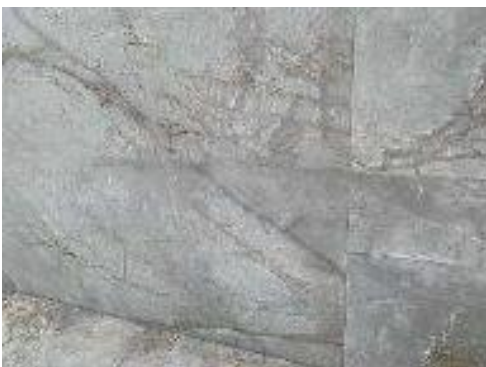
IMAGEN 9.14: PAREDES

En los jardines frente al campo de golf, se permite una pared en blanco o gris. La pared debe estar fuera del límite de la propiedad y no ser más alta que 120 cm. Para instalarla entre 2 jardines, se requerirá el acuerdo de ambos propietarios. En ambos casos se puede quitar el seto.