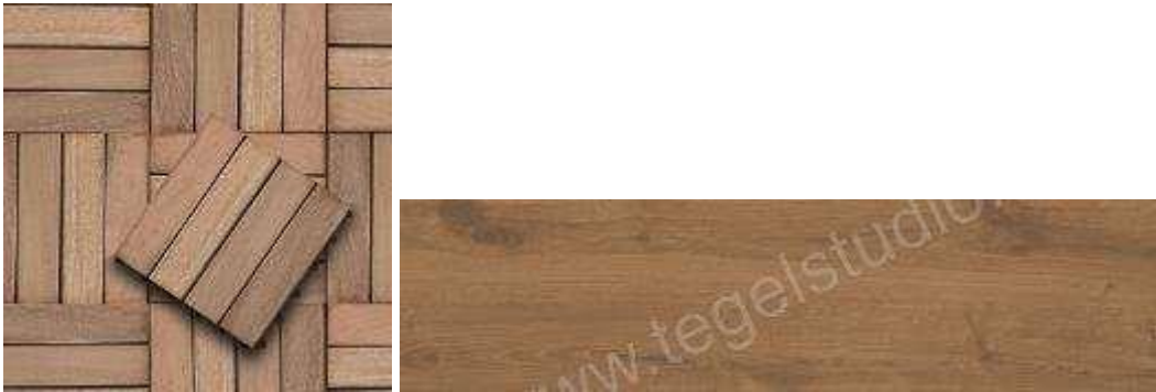
IMAGEN 10.3: ENLOSADO COLOR MADERA

Es necesario quitar y sellar el sistema de riego para evitar fugas y daños. Se deberá también acudir al Ayuntamiento para su autorización pertinente.