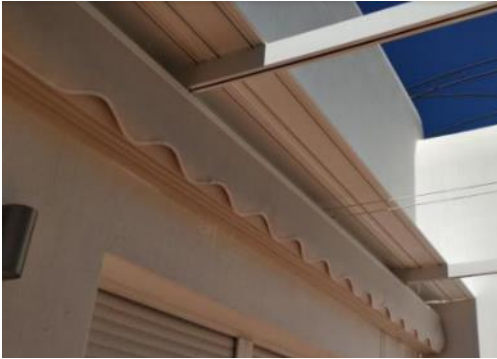
IMAGEN 10.1: TOLDOS

Pueden instalarse cubiertas para toldos de un color similar al del toldo. Ver foto.