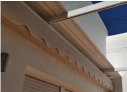
FIGURA 4.1. TOLDO

Pueden instalarse cubiertas para toldos de una anchura máxima de 50cm, de un color similar al del toldo. Ver foto.