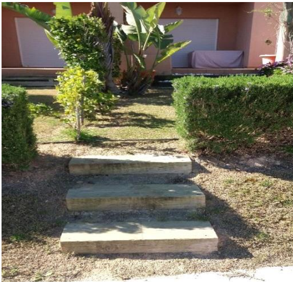
IMAGEN 7.1: ESCALONES

La instalación constará de madera tratada o madera tratada y losas. Las losas deberán ser similares a las existentes en La Isla, por ejemplo, de terracota, no deslizantes. La madera debe ser similar a una traviesa de jardín, cuya sección será de dimensiones 200x100mm y ser cortada a una longitud apropiada. Los propietarios correrán con el gasto y se recomienda que este trabajo sea llevado a cabo por los contratistas empleados en la Comunidad, como por ejemplo, STV