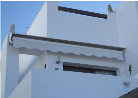
IMAGEN 5.2D: TOLDOS (ENTRADA SEGUNDA PLANTA)