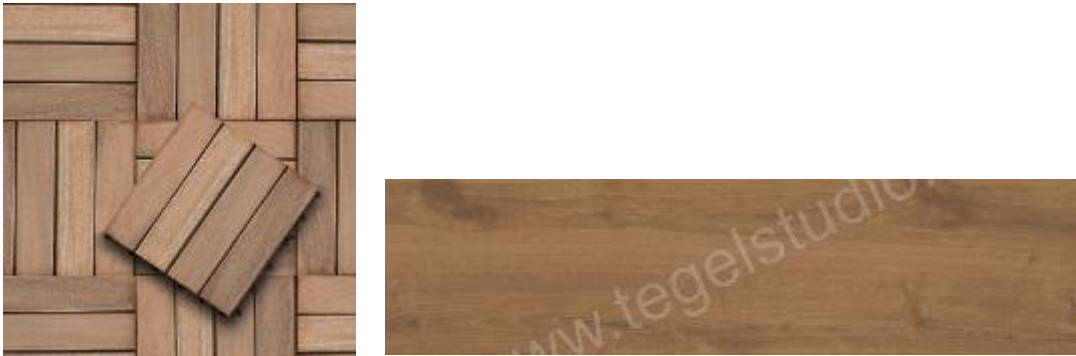
IMAGEN 9.10: ENLOSADO

COMUNICACIÓN PREVIA (Notificación del trabajo al Ayuntamiento)