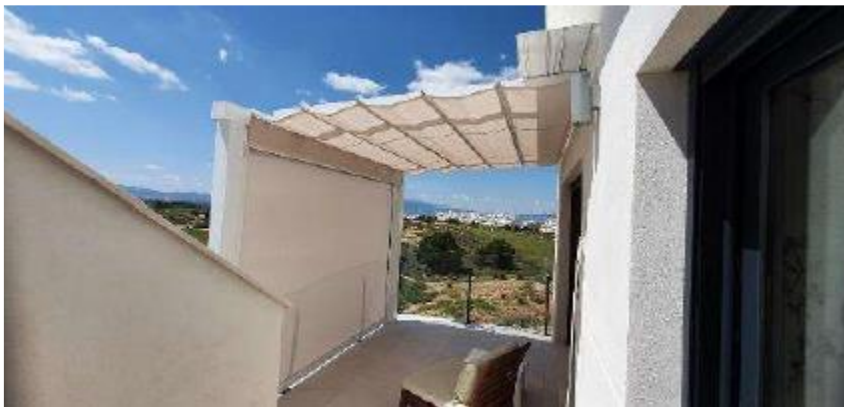
IMAGEN 9.3: CONSTRUCCION TOLDOS

Se permite una construcción para alojar los toldos siempre y cuando no genere un espacio interior fijo permanente.