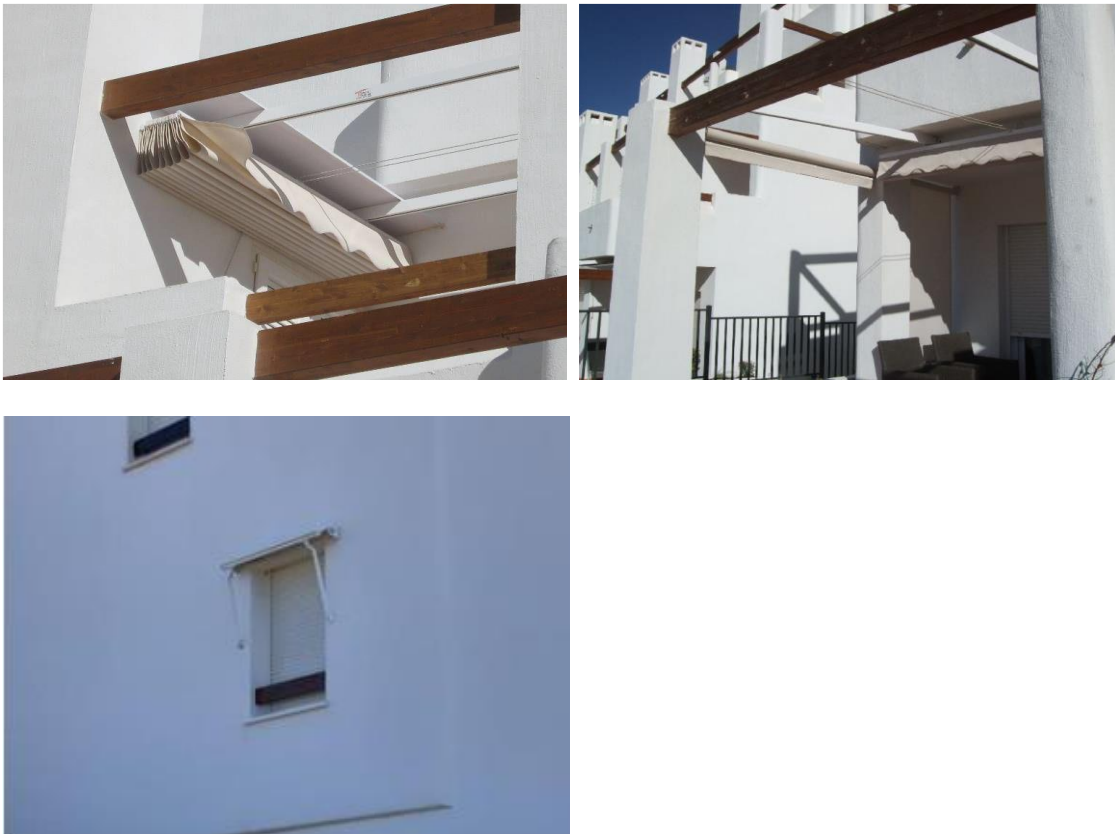
IMAGEN 6.1: TOLDOS

Todos los toldos para Penthouses serán de color blanco o blanco roto.