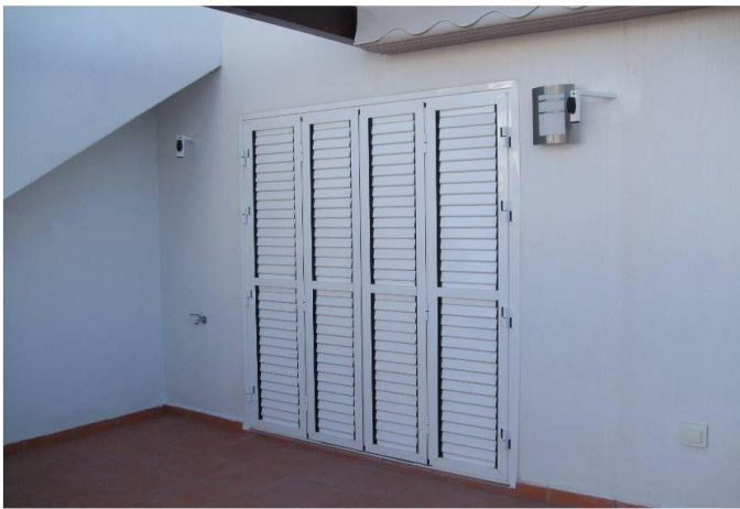
IMAGEN 5.4A: PERSIANA – PLANTA BAJA

Persianas o similares están permitidas. Estas deben ser de aluminio o PVC únicamente en color blanco y alineadas con la fachada.