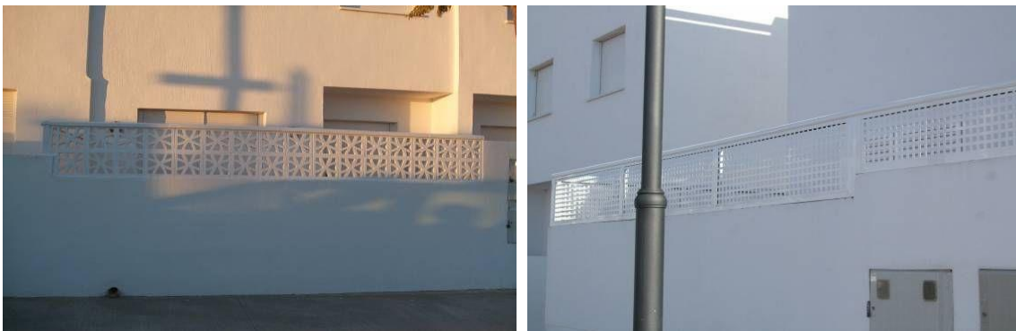
IMAGEN 4.8: PAREDES EXTERNAS Y CELOSÍAS

Paredes o celosías no deben exceder los 1800 mm de altura desde el suelo de la terraza de la propiedad.