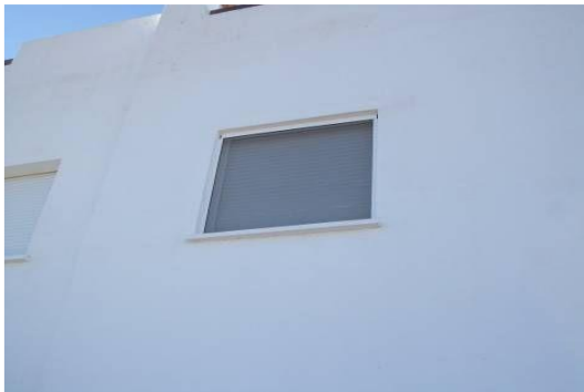
IMAGEN 4.6: MOSQUITERAS

Está permitido instalar mosquiteras en cualquier ventana, puerta o estructura, siempre que sean desmontables.