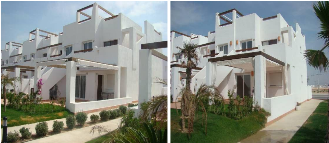
IMAGEN 5.2A: TOLDOS (PARTE DELANTERA – PLANTA BAJA)

Los toldos retráctiles también están permitidos cuando están instalados en las pérgolas o cuando están instalados en la pared externa en las propiedades de arriba donde cubren la puerta delantera.