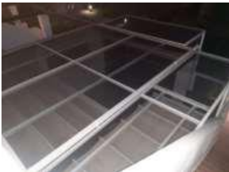
IMAGEN 10.1: CUBIERTAS

Se deberá también acudir al Ayuntamiento para su autorización pertinente.