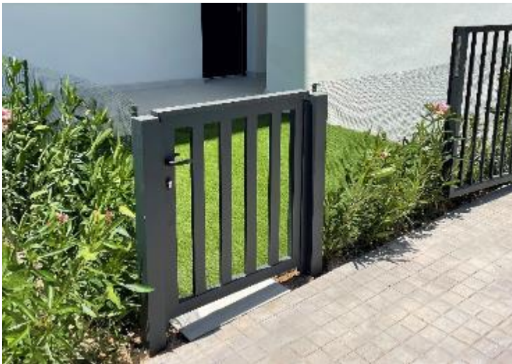
IMAGEN 9.5: PUERTAS

Las puertas están permitidas en la parte delantera de las viviendas. Deben ser color antracita y cumplir con la estética de las puertas existentes en la planta baja.