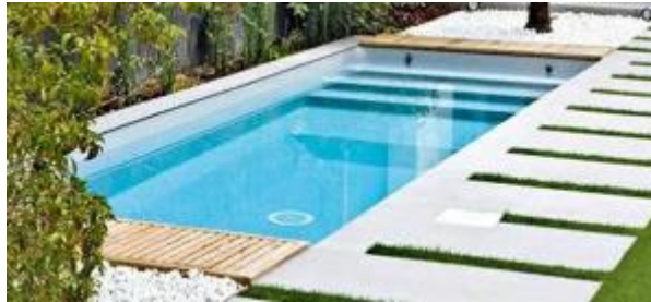
IMAGEN 9.1: PISCINA

La construcción de piscinas y jacuzzis está permitida en los jardines traseros así como enlosar alrededor. Esto debe llevarse a cabo utilizando las mismas losas (o similares) que las del resto de la terraza o una losa tipo/color madera. No se permiten otros colores diferentes.