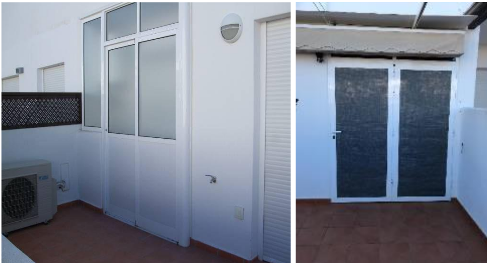
IMAGEN 5.5B: ALMACENAMIENTO PARTE TRASERA O DELANTERA