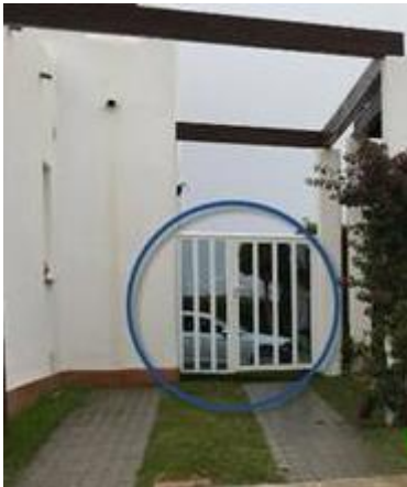
IMAGEN 8.5: PUERTAS

Las puertas están permitidas en el lateral y frontal de la propiedad. Deben ser blancas o marrones.