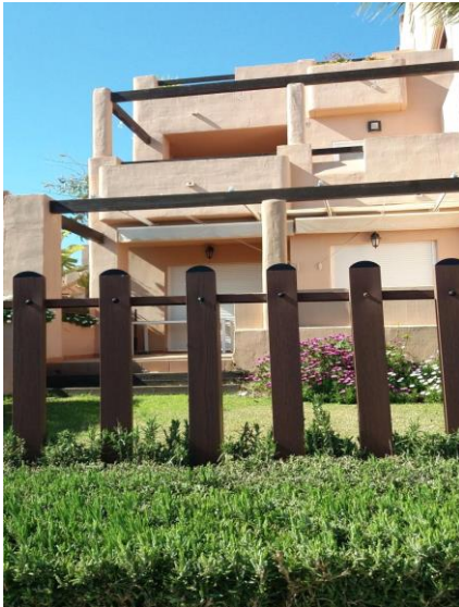
IMAGEN 7.5: VALLADO PLANTA BAJA

DECLARACIÓN RESPONSABLE (documento especial para vallados)