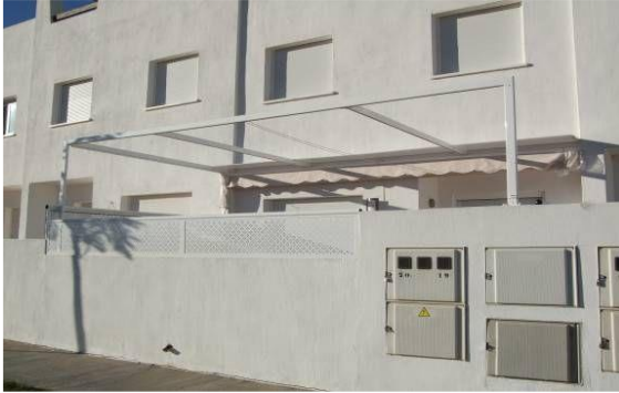
IMAGEN 5.2B: TOLDOS (PARTE TRASERA – PLANTA BAJA)

Se permiten toldos en la terraza trasera, pero no deben ser más altos que el límite de la propiedad.