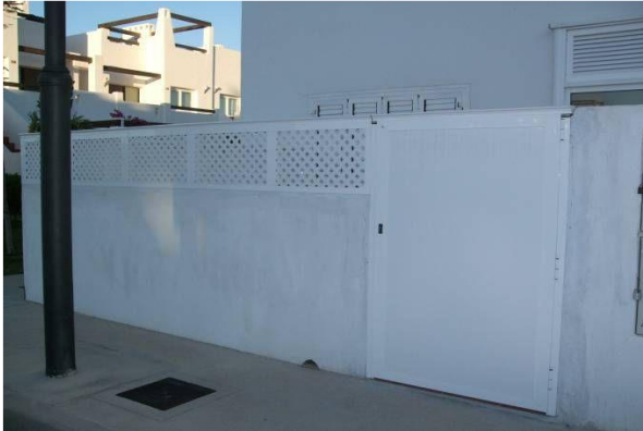
IMAGEN 5.6: PUERTA TRASERA

Las puertas traseras están permitidas y solo deben ser de color blanco. Deben estar instaladas de forma que el escalón no exceda 180mm de altura como estipula el código técnico de la edificación. Las puertas no deberían ser más altas que las paredes colindantes.