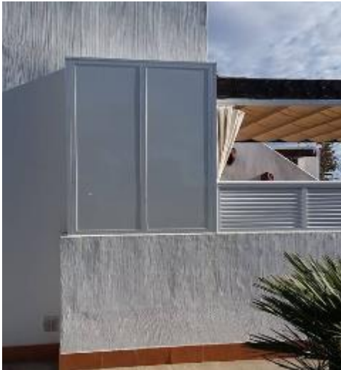
IMAGEN 5.10: CORTAVIENTOS

Se permite en los apartamentos finales instalar ventanas fijas para cortavientos. Los marcos deben ser de color blanco en PVC o aluminio. Paneles blancos sólidos también están permitidos en lugar de una ventana. La barrera contra el viento no debe extenderse más allá de la línea exterior del muro de la propiedad ni crear un espacio ocupado para los residentes. Cualquier otra forma de protección contra el viento o la sombra debe ser desmontable.