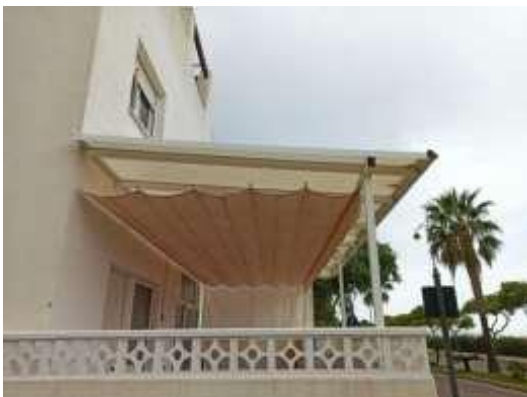
IMAGEN 10.2: ESTRUCTURAS O CERRAMIENTOS FIJOS

Las estructuras o cerramientos fijos no están permitidos, excepto para sustentar las mosquiteras, cubierta para toldo o como una extensión de pared o celosías adicionales, y deben cumplir con las condiciones enumeradas en este documento. Se deberá también acudir al Ayuntamiento para su autorización pertinente.