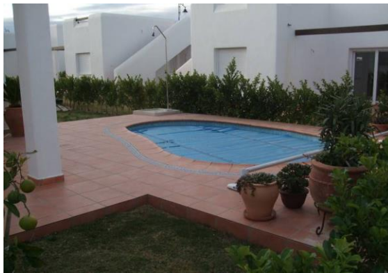
IMAGEN 8.1: PISCINA

La construcción de piscinas está permitida en la parte trasera de los jardines junto con la ampliación de la zona enlosada para rodearla.