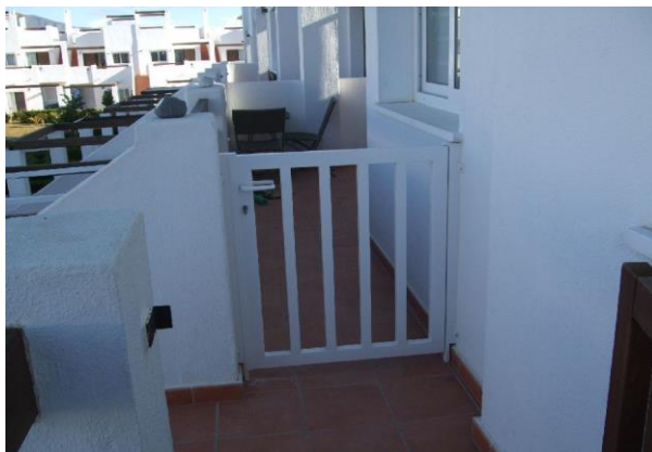
IMAGEN 5.8: PUERTAS – PRIMERA PLANTA

Se pueden instalar puertas de repuesto en la entrada de un apartamento de primera planta. Estos deben ser de color blanco o marrón nogal y no más altos que el muro actual.