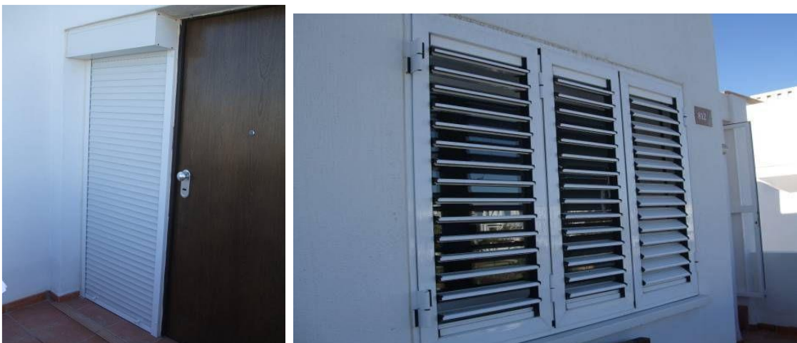
IMAGEN 5.4B: PERSIANAS – PRIMERA PLANTA