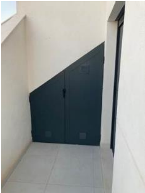
IMAGEN 9.11: CERRAMIENTOS PARA ALMACENAMIENTO (PERMANENTES)

Se permite también su realización en el color original de los marcos de las ventanas (negro antracita).