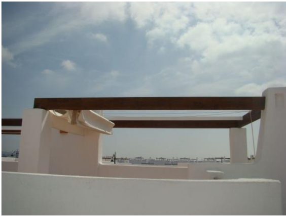
IMAGEN 5.2C: TOLDOS (TERRAZA SEGUNDA PLANTA)