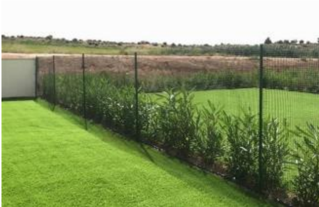
IMAGEN 9.7: VALLAS