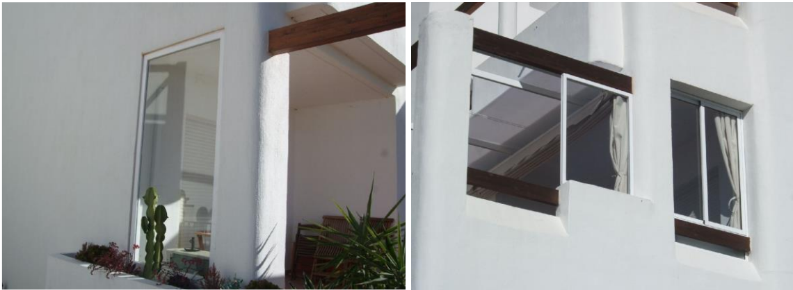
IMAGEN 6.3: CORTAVIENTOS

Se permite en los apartamentos finales instalar ventanas fijas para cortavientos. Los marcos deben ser de color blanco en PVC o aluminio. Paneles blancos sólidos también están permitidos en lugar de una ventana. La barrera contra el viento no debe extenderse más allá de la línea exterior del muro de la propiedad ni crear un espacio ocupado para los residentes. Cualquier otra forma de protección contra el viento o la luz debe ser desmontable.