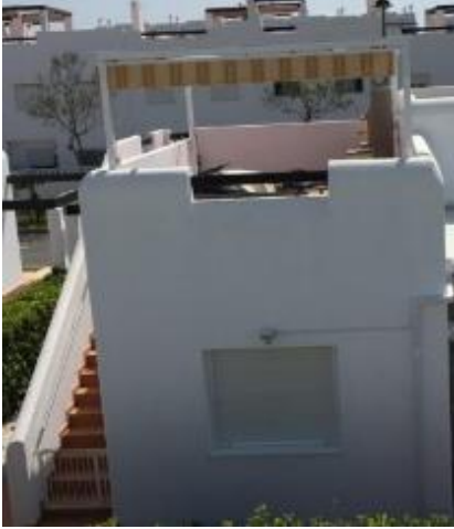
IMAGEN 8.4: PARASOL

La construcción de una estructura blanca de aluminio necesaria para soportar un toldo retráctil en la terraza/solarium de la planta de arriba está permitido.