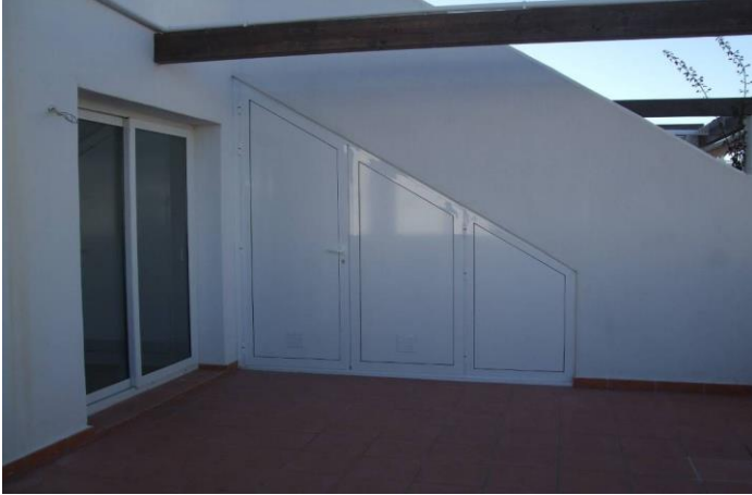
IMAGEN 5.5A: ALMACENAMIENTO DEBAJO DE ESCALERAS